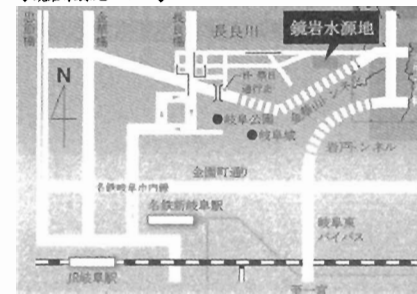
◆鏡岩水源地マップ◆

◆主催：ぎふまちづくりセンター◆ 〒500 8833 岐阜市神田町5-4 TEL/058 263-7180 http://gifu-machi.com cjmu@gifu-machi.com